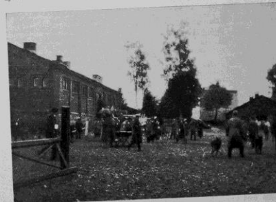
Från utställningen 15—16 sept. 1928.

15. Leipt av Bali (Champ. Sultan av Orleans—Teika av Orleans). En knäppt 20 mån. gammal, mycket kraftig och långsträckt hanhund med särdeles goda proportioner och vinklar. Mycket god rygglinje och bröstorg; samt vacker svans. Halsen något kort. Huvudet något tungt. Tyvare var hunden på det stora hela taget något tung och lös, något intressant att se, hurudan denna hund blir, när den är fullt utvecklad. Med sitt goda schäferhundsanses var den ett utomordentligt tilltalande djur. 1. pr.