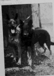
De båda champ. Sultan och Tuttsy.

hava under senaste tid, dels på grund av sjukdom, och dels på grund av olycksfall gått till sina fäder för att jaga i frihet på de sålts jaktmarker.