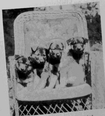
Rebus: Hur många valpar finns i stolen?