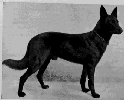
Stieger 1906/07 ROLAND V. STARKENBURG S. Z. 1537