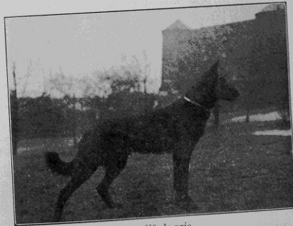
Lux, fjärde pris.