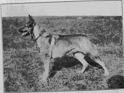
Tuttsy, första pris.