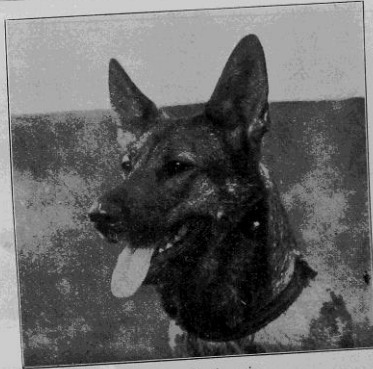
Tuttsy, första pris.

HÖGFINA RIKLIGT SLIPADE KRISTALLER, GRAVERADE KONSTGLÄS TILL LÄGSTA PRISER FRÅN FÖRNÄMSTA FABRIKER