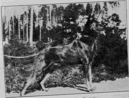
Muck av Orleans, tredje pris.