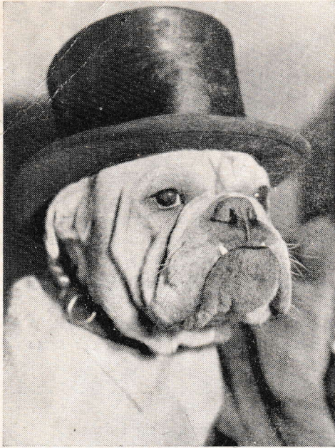
Är husse eller hunden fulast? Jag vet ej, dock är hunden kulast.