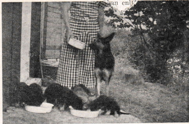
Champion Monahells' Dou-Dou med valpar e. Champ. Greif på lantstället Rosenvik, Blidö, sommaren 1935.

Bland tikarna var det Alpåsens Bonny, 148 GG, och Lordy Excelsior, 1350 HH, som kämpade om segerpalmen. Bonny, redan 4 år, är mycket kraftig och harmoniskt byggd, har ett utmärkt uttryck och är trots flera valpkullar ännu helt fast i ryggen. Lordy, bestickande, elegant, ungdomligt tjugande, men för sin höjd står hon ifråga om bredden på gränsen. Jag avgjorde där-