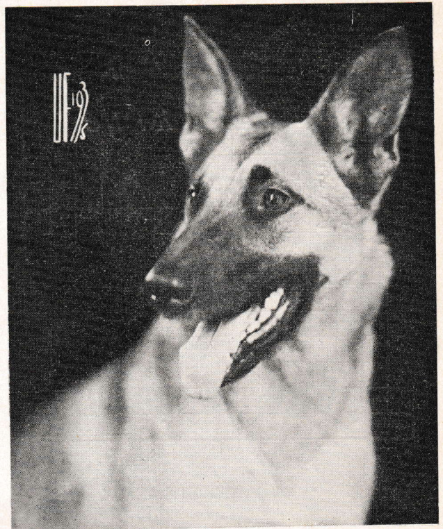
Schäfertiken Mona hells' Tuttsy