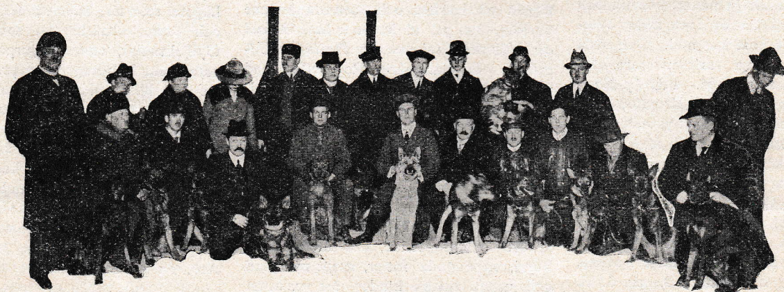
GRUPPBILD AV KURSELTAGARE MED HUNDAR

Föreningen Sv. Skydds- och Sjukvårdshundens 4:de kurs för utbildning av gentlemannaförare.