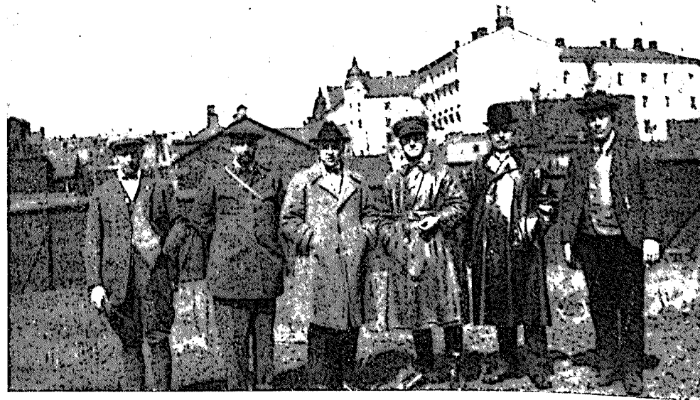
Examensnämnden samt dressyrskolans instruktör 1923.

Efter det appellövningarna och figurantarbetet undanstökats på området vid Gasverkets Södra koksstation, vidtog det av förarna så fruktade muntliga förhöret. Detta