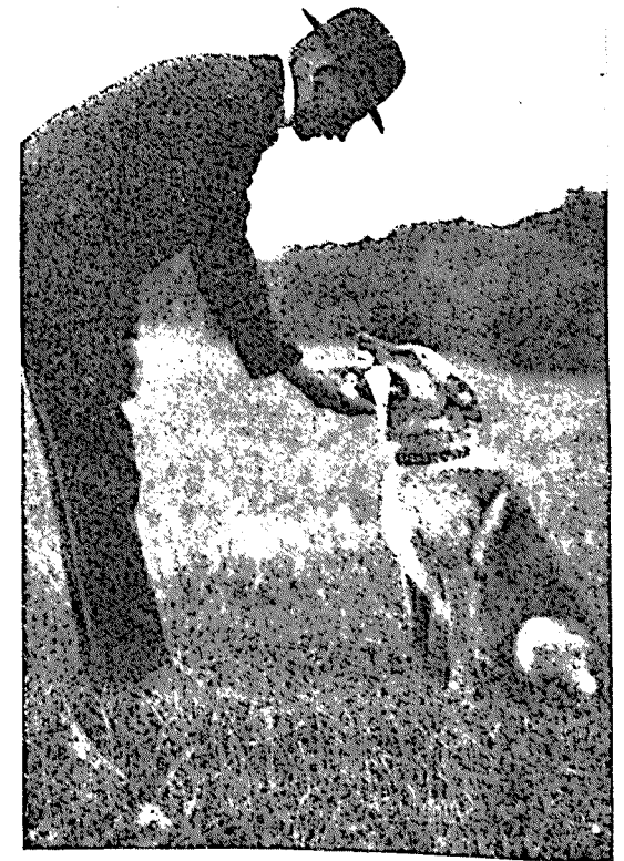
Avlämnande av apport.

g) Hämtande av kastat föremål genom klättring över minst 185 cm. hög plankvägg. Inlärandet av detta moment bör icke taga sin början förrän hunden lärts apportera och hoppa över 120 cm. hindret. Ett mycket vanligt tillvägagångssätt är följande: Man förfärdigar en 1 1/2 meter bred plankvägg med liggande bräder och så uppsatta att väggen kan höjas och sänkas efter behov. Väggen uppsattes vid de första lektionerna till 130 cm. höjd. Härefter föres hunden kopplad runt hindret några varv, varpå man låter hunden förd i tillräckligt lång lina hoppa en gång fram och tillbaka. Dessa förberedande rörelser göras för att vänja hunden vid hindret. Visar hunden ingen skygghet för detsamma för man upp honom mot hindret och stannar på lagom avstånd (omkring 6 steg från detsamma.