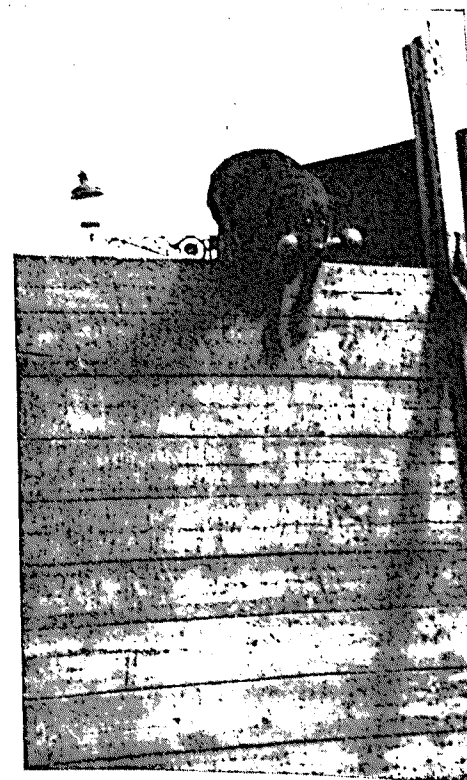
Rottweilertiken Mary tar på examensdagen det höga plankhoppet.