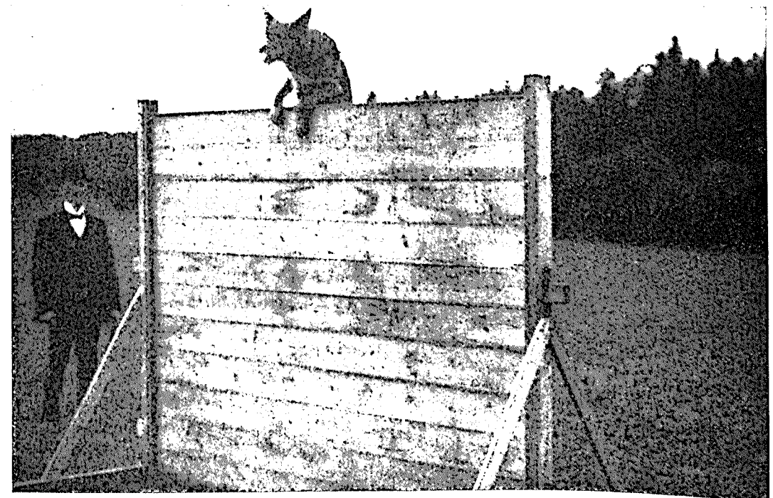
Hopp över 2 meter högt plank.

Så till sist ett allvarsord i en hederssak till damer och herrar utställare. Låt bli att, i vilken form det vara månede, klandra utställningens funktionärer, såväl arrangörer som prisdomare. Dessas arbete är nämligen