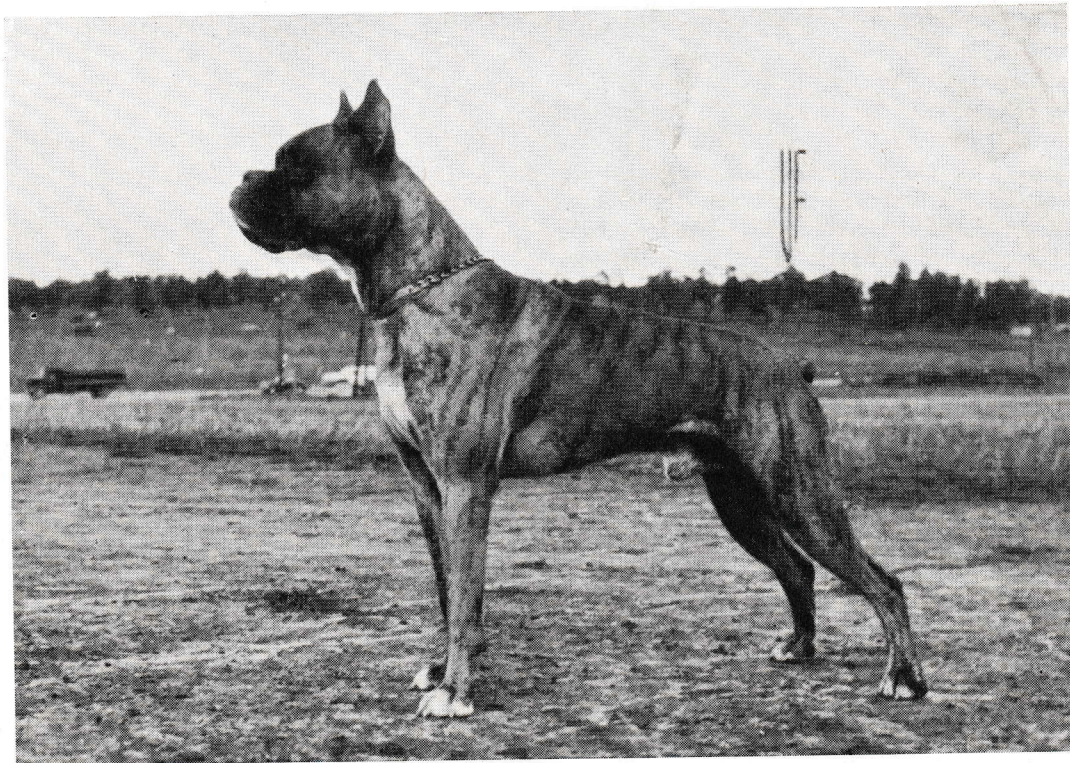
Birbos Big Ben 11393/46, äg. fru Åsa Fjästad, Lidö.

Gotland (appellklass, alla grupper i nybörjar- och högre klass) 4/12.