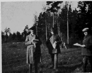
Tre nöjda domare.