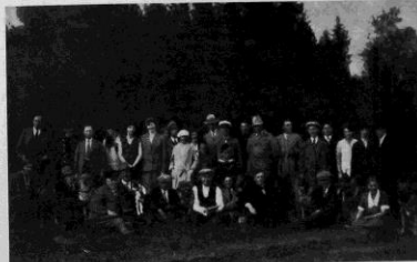
Grupp av deltagare.