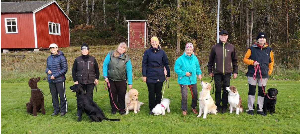
Bild från kursen Rallylydnad nybörjare fortsätter.