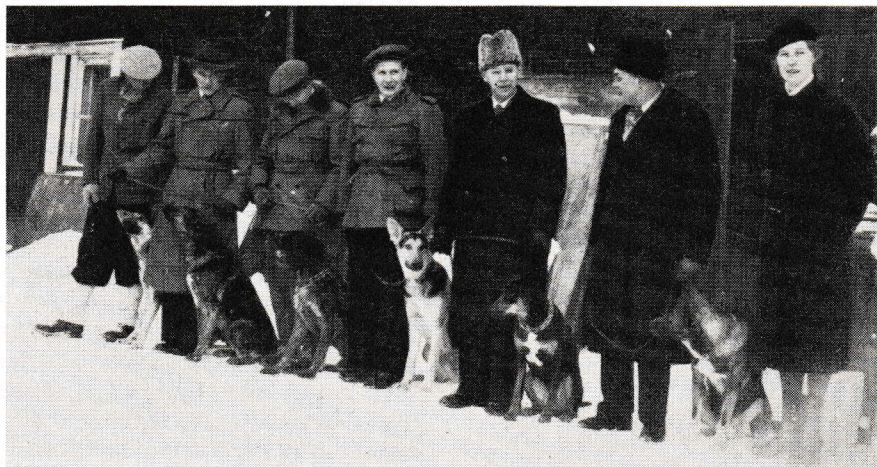
Några intresserade medlemmar från Borlänge

i landsorten arbeta som aldrig tillförne, och resultatet har blivit ökad medlemsstock.