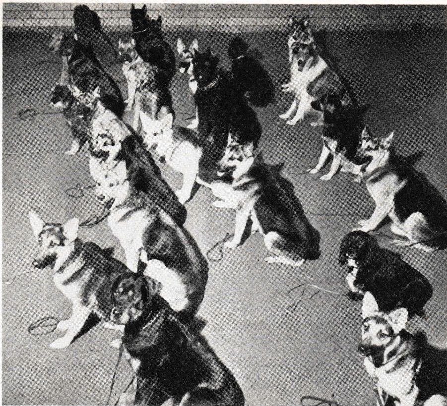
Alla lika snälla och rara. En bild från stockholmsavdelningens höstkurs vid Kungl. Veterinärhögskolan

tallrik ärtsoppa och en smörgås kan lämpa sig utmärkt »i fält». Det är både billigt och bra och det bästa är gott nog. Bort med dyra restaurangbesök, därför att klubbarnas ekonomi inte tål en sådan påfrestning!