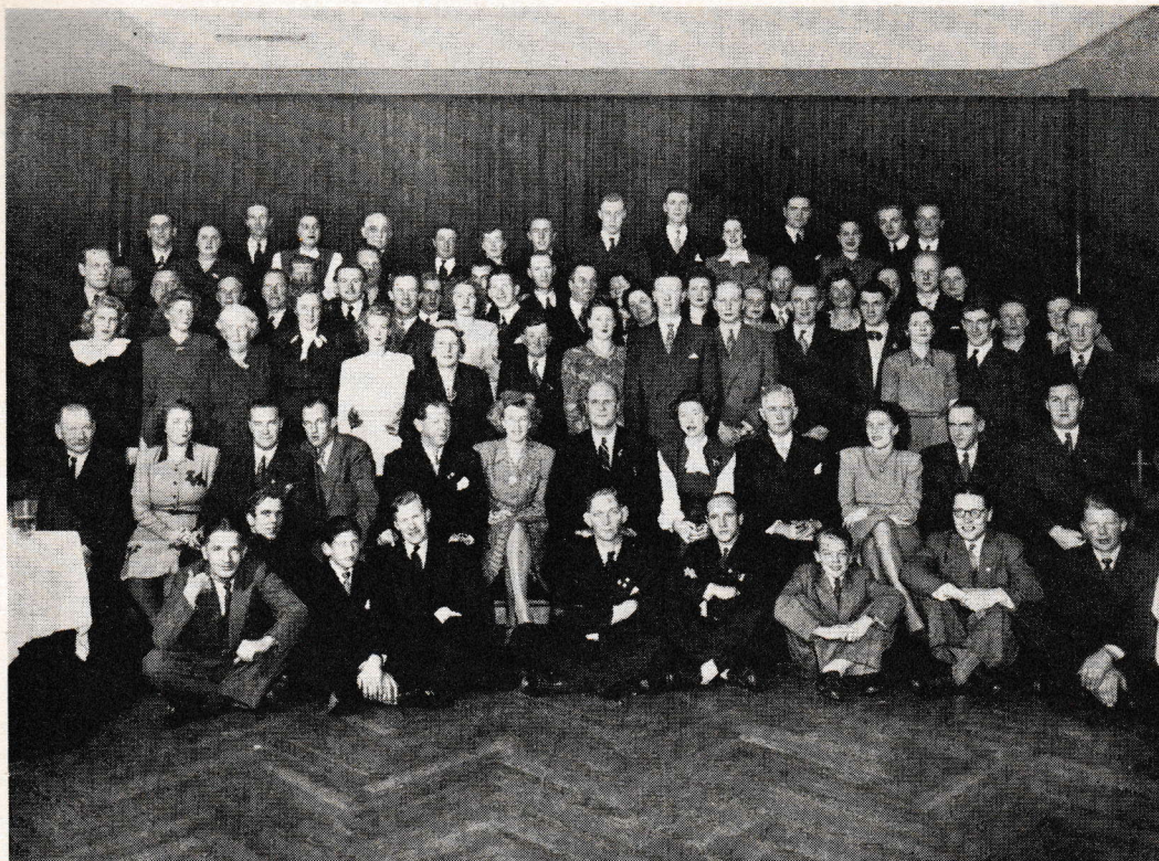
En trevlig bild från Göteborgsavdelningens höstfest den 1 december 1946 å Coldinordens restaurang

Den alldagliga, något enformiga informationen om småsaker rörande hundarnas skötsel och uppträdande måste fortsätta även med risk att äldre medlemmar klagar på att redaktören och kursledarna upprepar sig själva.