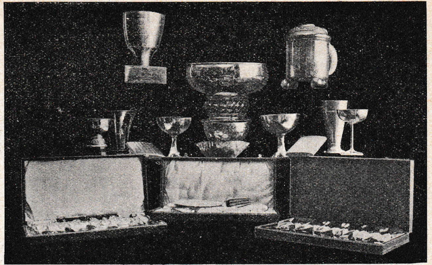
Priser vid Skydds- och Spårhundstävlingarna.