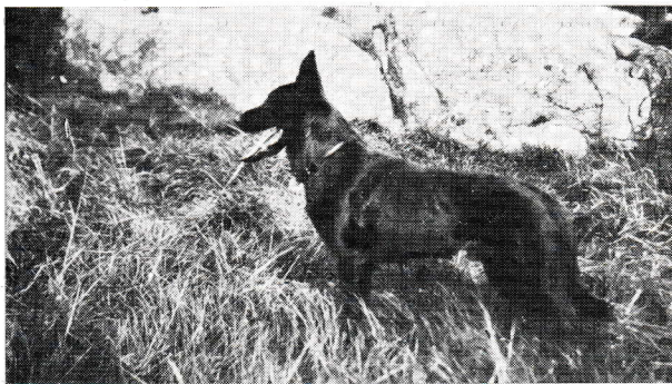
Filmstadens Kelloo, SKKS 31 DD.