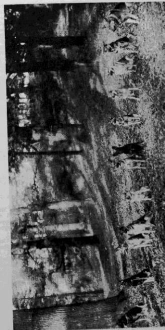
Sv. Schäferhundklubbens dressyrkurs. Hundarna ösa prov på god appetit.

Efter det jag för två år sedan på norska kennelklubbens utställning sett schäferhundarna i Norge, har det varit min önskan att jämföra tillfälle beskåda schäferhundarna i Sverige. Det var därför med glädje jag mottog Svenska Schäferhundklubbens inbjudan att vara domare på årets utställning i Stockholm.