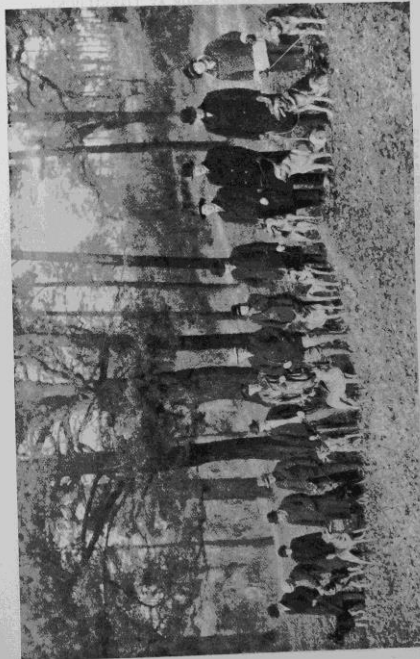
En grupp lärare och hundar från Sv. Schäferhundklubben, pågående dressyrkurs.

Nästa nummer av Svenska Schäferhundklubbens Tidskrift, som utkommer under innevarande december månad, är ett dubbelnummer på c:a 40 sidor, utgivet av Svenska och Danska schäferhundklubbarna gemensamt.