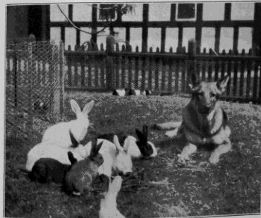
Den för djurbehandling så färliga schäfer!

gång i segrarklass. Om dessa båda goda hundar vill jag framhålla: