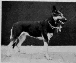
Monahell's Dou-Dou, S. K. K. S. 448 G. G.