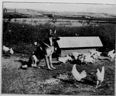
En färlig schäfer i sällskap med sina vänner!

Hans broder, också en gammal erfaren hundpappa, blev tvås med Goeben. Om denna klass där självfallet mycket vore att resonera om, måste jag tyvärr endast konstatera: