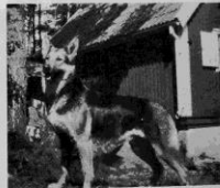
Vibos Mona-Lisa, S. K. K. S. 255 E. E.