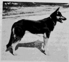
Monahell's Boffe, S. K. K. S. 858 F. E.