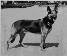
Segehos Graff, S. K. K. S. 546 B. B.