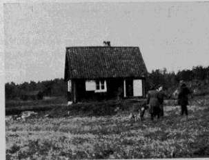
Ovanstående bild ger en föreställning om klubbens nyförvärvade sportstuga.

Stugan är belägen invid Skarpnäcks gård i Stockholms omedelbara närhet samt omgiven av de mest idealiska spårmarker. På platsen finnes fullständig dressyrattiralj, och varje söndag samlas där ett stort antal klubbmedlemmar för att träna sina hundar.