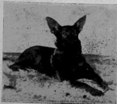
Roja, e. Käck av Lövsund, u. Aia II. Äg.