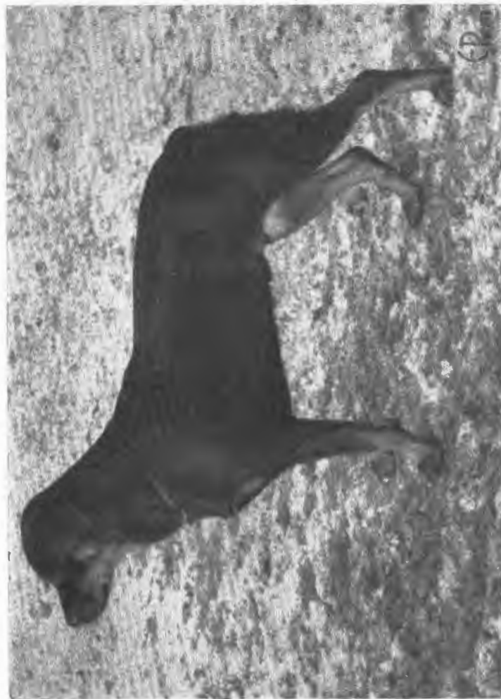
OLS KENNEL, OLS BUSTER, SKKS 735 PP, äg. Gösta Olsson, Tegnebyvägen 12, Ångby, Telefon 37 17 13. Buster, som är en av landets såväl utställnings- som bruksprovschampion, står till avelstjänst