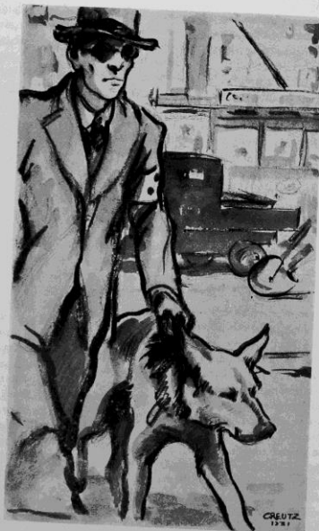
Och ibland kan man möta otroliga exempel på en hunds klokhet. Sålunda: På trottoarkanten står den blinde, vid hans sida schäfern.