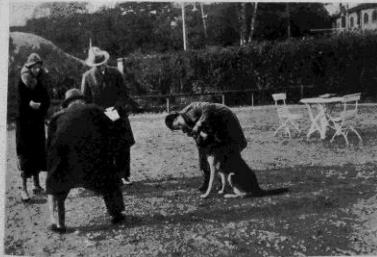
Guard, 682 E. E., visar sitt tandgarnityr.