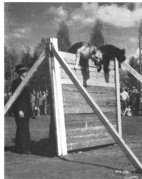
Boden: Bosco och Adja i parhopp.

ett enkelt dressyrprogram med hopp och balansgång, utfört av en grupp som sammansatts av de mest skilda hundraser: två schäfrar, en riesenschnauzer, en newfoundlandhund, en vorsteh, en liten pudel och en finsk spets, samt