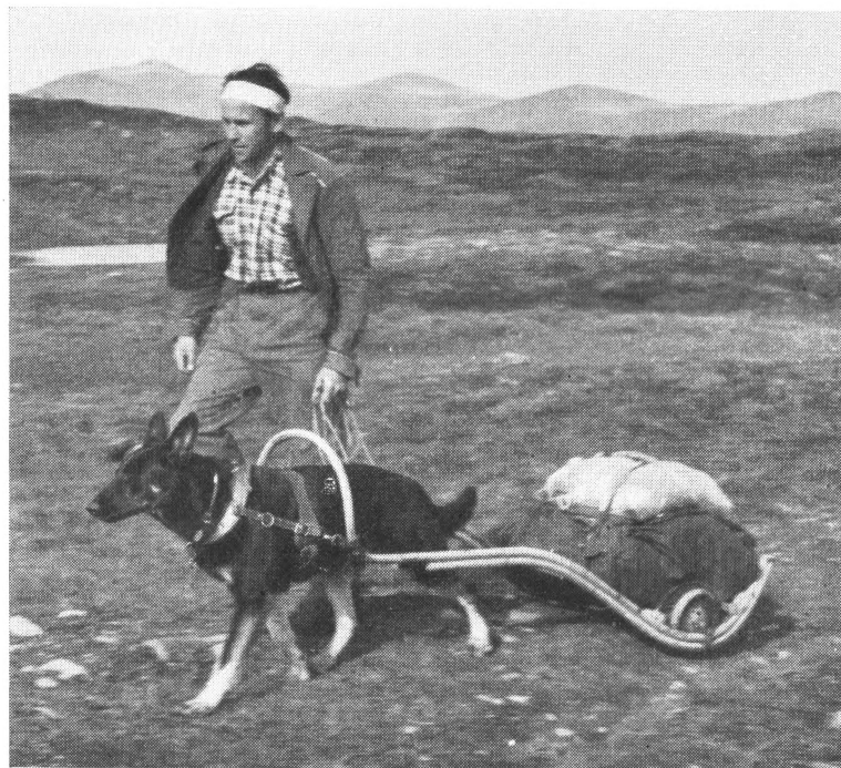
SLÄPA av modell Lundin.

En stor fördel med klövjevaskor är den stora smidighet varmed hunden kan följa sin husse eller matte, vare sig det gäller färder över färgskiftande fjällvidder eller över stock och sten bland lummig grönska i låglandet. Detta under förutsättning att det är gott material i utrustningen och att de alltid erforderliga reservgrejerna medförts (lösa remmar, säljor och nitar).