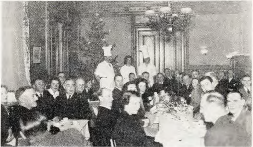
En bild från Gbg:s avdelningens Luciafest