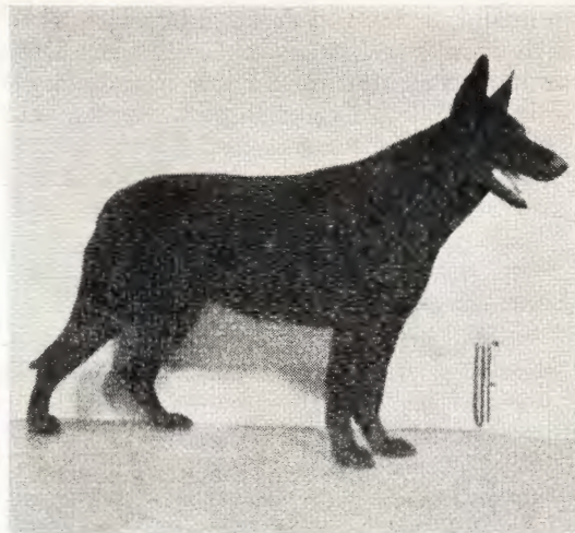
Lula av Åsabo, SKKS 1344 UU.