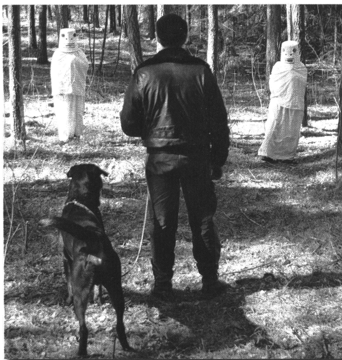
Mentalbeskrivning Hund – MH.

Karaktärsprovet försvinner som provform. Mentalbeskrivning Hund (MH) kommer att användas för liknande syften, men med en del mycket viktiga skillnader. Det ställs inget krav på vissa värdesiffror i MH utan det anses tillfyllest att hunden har en känd mental status.