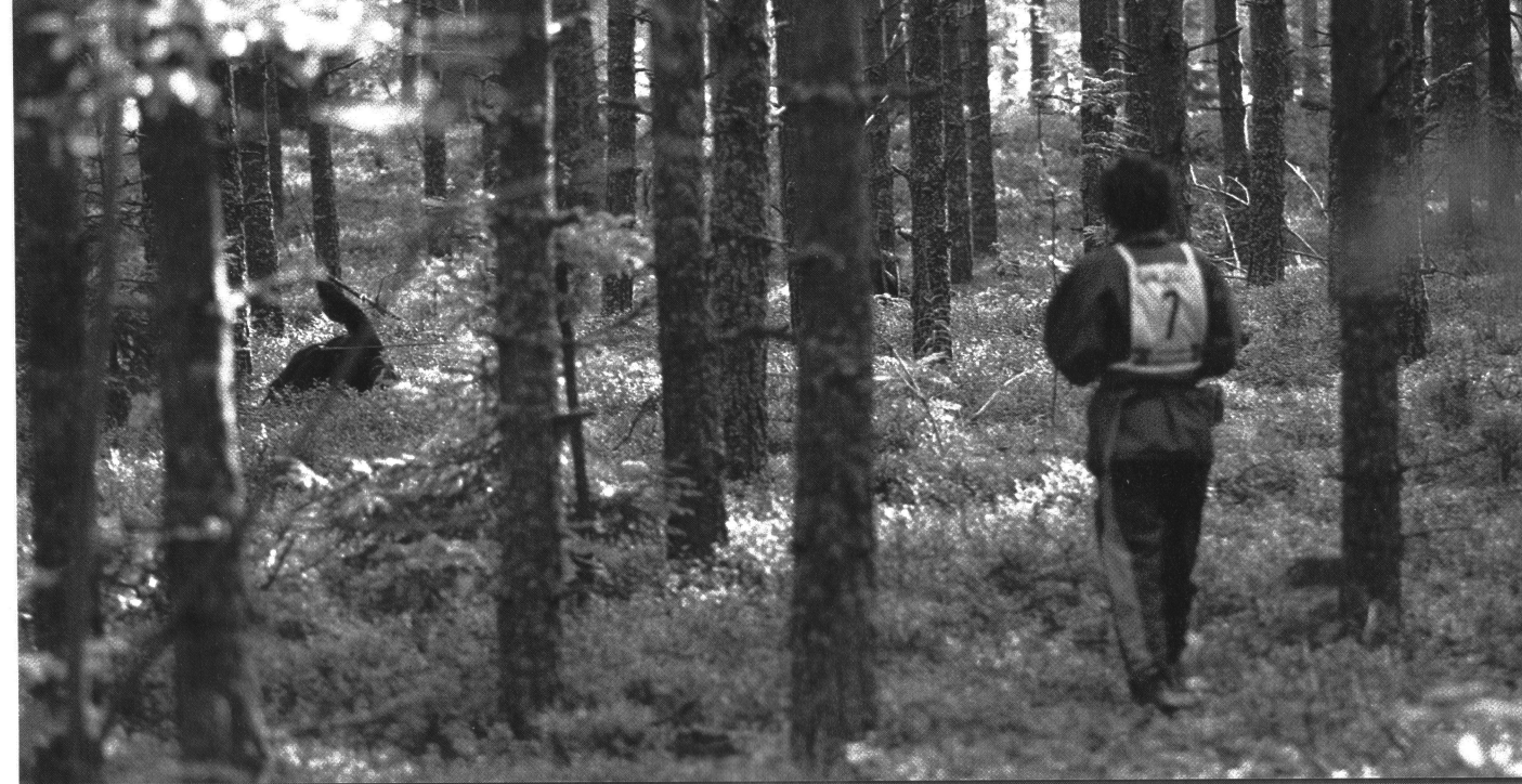
Spårlinan får vara max 15 meter, varav minst 10 meter mellan förare och hund vid arbete i överskådlig terräng.

Kraven på tjänstgöring för domare och skyddsfiguranter höjs till minst en gång per kalenderår. För domarna kan deltagande vid regional domarkonferens tillgodoräknas som tjänstgöring.