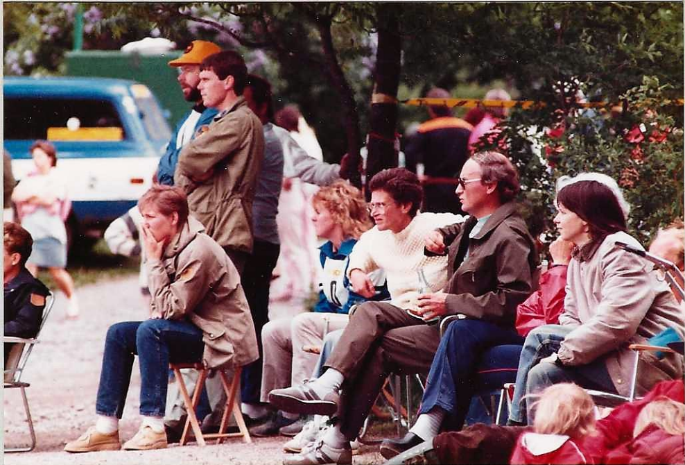
VÄSTERÅSARE I SPÅND FÖRVÄNTAN