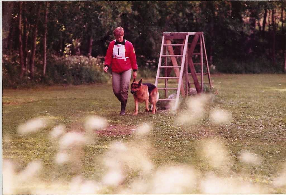
ÄNTLIGEN KLARA ?