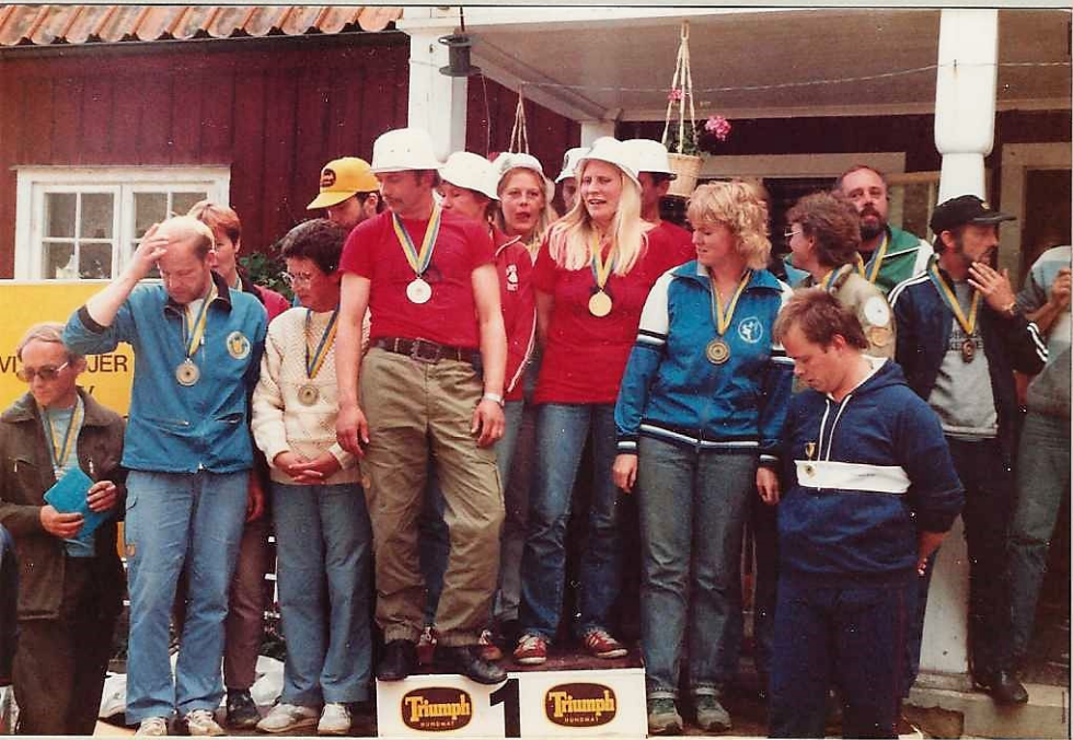
VÅSTERÅS STOCKH., AVD. ESKILSTUNA