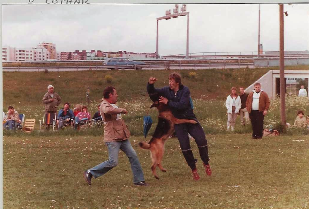
S. ANGLERFJORD O P. DUX