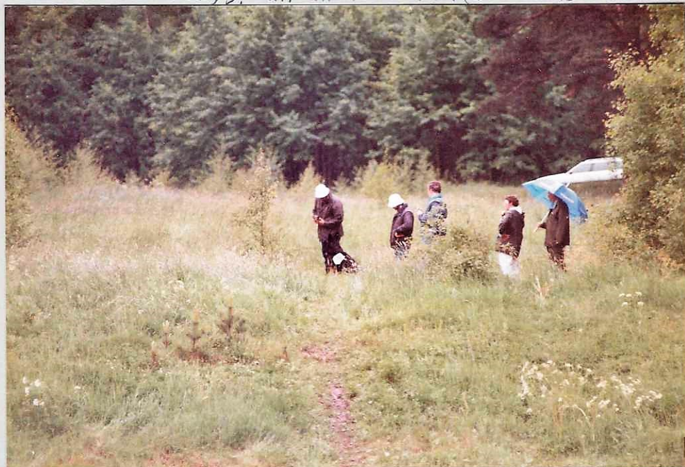
JEVEMO & DOSSAM