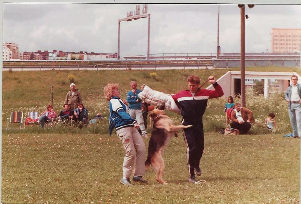
LENA URBAN E-TUNA O LOTHAR