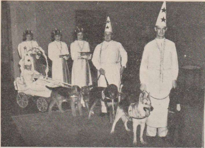
Från Stockholms- avdelningens jul- fest på Gillet.