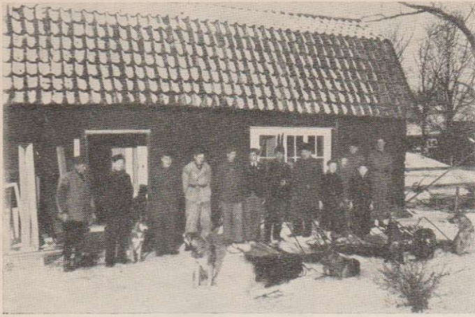
Ett tiotal hemvärnare med hundar och pulkor framför Vallby Västergård under arbetet med iordningställandet av den gamla ödestugan.