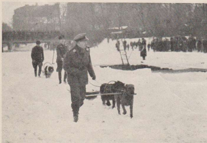
Alla raser kunna dra pulkor — Skånehundar i arbete

Malmö äldsta trimningsinstitut är HUNDCENTRALEN Försäljare av KARO vitaminpreparat Medicinska bad DAVIDSHALLSGATAN 8 - TELEFON 19362