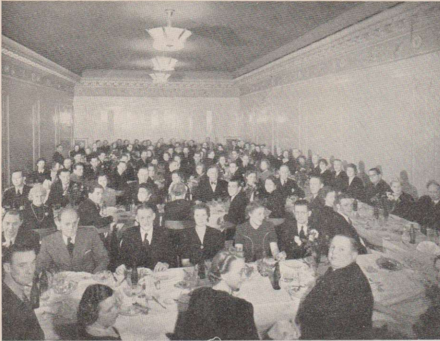
175 personer deltog i Stockholmsavdelningens julfest på Gillet