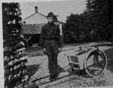
Brännings M.G.-skärra apterat för telefontolkning. I den löstgärdade lödan (låt endast med vunen framfyll) finnes inmonterad telef-spp. + 6 km. dubbelledn. jämte plats för hundbröd för 2 dagar.

Släddertypen är det egentligen som här varit »stridsäpplet». Där bryta sig åsikterna ännu hos och här användas »pulkka», »skantschatkasläde» och »tobogga» m. m. jämsides. Man har ju härvid att taga med i räkningen många olika faktorer, men det skulle föra för långt att närmare ingå på alla detaljer. Främst måste man av en hundsläde fördrå, att den kan »komma fram» och inte fastna i buskig terräng. Därför kan aldrig en typ på tvännen skidor vara användbar — omgitt min ringa erfarenhet: har blott ca 20 år använt hunden såsom dragare — utan skall det vara »skidor» måste dessa framfyll vara förbundna med en bäge, som bärar undan kvistarna o. d. och som tager emot stötarna. Överhuvudtaget är det ju för oss nordbor relativt lätt att lösa detta problem. Vi behöva ju endast sätta oss in i de olika system, som