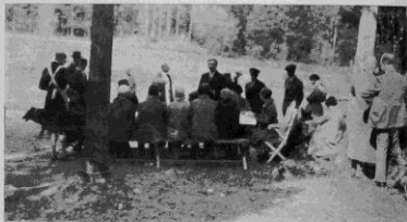
Grupp av deltagare.