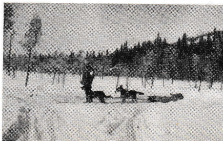
Terrängen kring Sollefteå är utmärkt för arméhundsutbildningen.

En hunds dragkapacitet kan sättas i direkt förhållande till hans egen, levande vikt, och han tager i »nyttig last» också denna viktenhet, i medeltal räknat. Detta kan ju, ytligt betraktat, synas ganska obetydligt — 30—35 kg för en hund, 70—80 kg för två — men när terrängen och snöförhållandena bli sådana, att man inte har någon annan draghjälp att påräkna, och skidlöparna själva skola börja på att släpa fram sin nödvändiga tross — tält, ammunition, kulsprutor och proviant samt icke minst, undanföra sina sårade — då är sannerligen draghunden bra att kunna lita sig till.