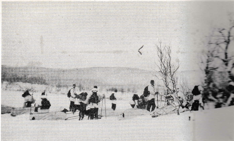
Från arméhundsutbildningen i Sollefteå.

Man hör ibland från »djurskyddshåll» tal om djurplågeri o. dyl. då det blir fråga om arméns — eller enskilda personers — utnyttjande av hunden som dragare. Det talet brukar emellertid — och underligt vore det annars — mycket snart förstummas, då man påminner vederbörande om det enkla faktum, att hunden bevisligen varit människans