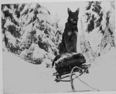
Schäferhunden som dragare.

Under en följd av år hava försök med hundar som dragare för skidkälkar etc. pågått bl. a. i Norge och Finland, och torde man i detta avseende där hava kommit över det första försöksstadiet. I dessa länder torde man numera komma till en ganska bestämd uppfattning om såväl hundarnas användbarhet, lämplighet och arbetskapacitet samt sättet för inlärandet av för ändamålet erforderliga kunskaper ävensom den materiel (selar och slädar m. m.), som härvid böra komma till användning.