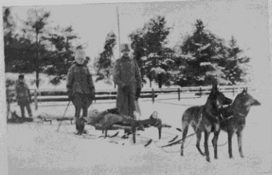
»Hundambalans»-skubb är utövad på skidor, dragen av två hundar.

Vad beträffar själva utbildningen för körning, d. v. s. att få hundarna att villigt och segt »lägga sig i selen» var detta en betydligt enklare sak än åtminstone undertecknad från början trott. Även om man i en del fall fick läkta ut från mycket livliga början (alla karaktärstyper voro representerade från mycket livliga till mycket lugna) för att icke hos någon hund väcka rädsla för selen eller släden, så vände sig samtliga hundar förvånande lätt vid de nya arrangemangen. Anspänningen var ordnad i parspar (en hund och en tik) eller undantagsvis enbet. Redan i slutet av första veckan gingo samtliga hundar lugnt och säkert i kolonnen. Naturligtvis voro slädarna i början tomma, och då dessas vikt