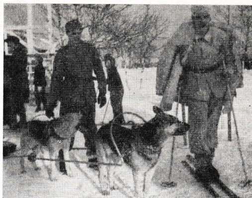
Segrande ekipaget i klass C1b.