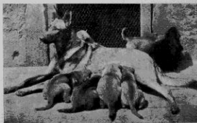
Schäferhundik med valpar.

Efter bedömningen, som verkställdes av klubbens ordförande, höll denne för kennelintresserade föredrag om avels- och uppfödningproblem, varpå följde ett par timmars intressant diskussion.