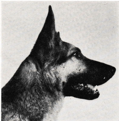
BILLO von HANNOVER DÖD.

Svenska Kennelklubbens avelshund BILLO VON HANNOVER 1102 MM, SZ 487366, född i Tyskland 14 oktober 1935, avled den 31 oktober 1948. Billo, som på förslag av den